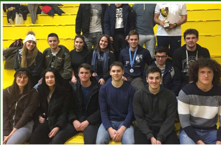
Studenti i studentice Sveučilišta na državnom prvenstvu u plivanju, Vukovar 2018.