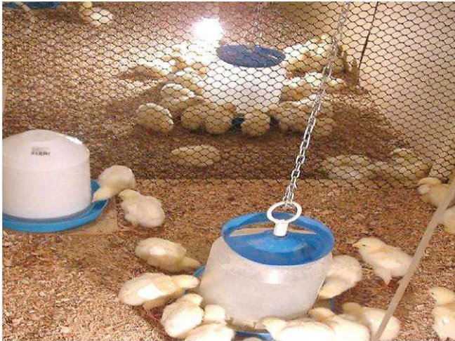
Biološki pokus s pilićima brojlerima