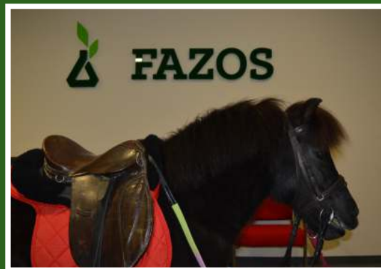
Pony Helena, Aktivnost iz konjogojstva, Smotra FAZOSA, 2018.