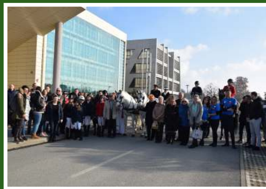
Europska noć istraživača na FAZOS-u, 2018.