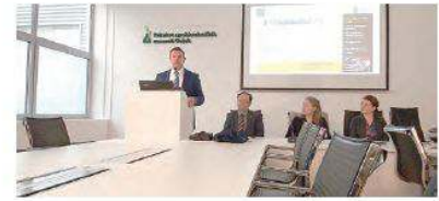
Informativni dan Fulbrightova programa na Fakultetu agrobiotehničkih znanosti Osijek