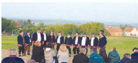
Predakademost Europske noći istraživača 2019. održana 17. svibnja 2019. godine u Mandićevcu

● Projekt provodi osamnaest partnera – Ministarstvo znanosti i obrazovanja RH i sedamnaest eminentnih institucija iz akademskoga znanstvenoga područja i privatnoga područja djelovanja. To su: Institut za društvena istraživanja, Institut Ruđer Bošković, Strossmayerov institut, Institut za jezičnu kulturu i mekloraciju brla, Medicinski institut za istraživanje života, British Council, Sveučilište u Zagrebu, Sveučilište u Splitu, Sveučilište u Zadru, Sveučilište u Dubrovniku, Sveučilište u Puli, Sveučilište u Rijeci, Sveučilište Josipa Jurja Strossmayera u Osijeku, Državni zavod za intelektualno vlasništvo, Hrvatsko katoličko sveučilište, Sveučilište Štefan u Hrvatskoj zaklade za znanost. U pripremi, organizaciji i provedbu osječkog dijela ENI-ja 2019. uključeni su Fakultet agrobiotehničkih znanosti Osijek, Prehrambeno-tehnološki fakultet Osijek, Fakultet za odgovorne i zdravne znanosti u Osijeku te Fakultet elektrotehnike, računarstva i informacijskih tehnologija Osijek.