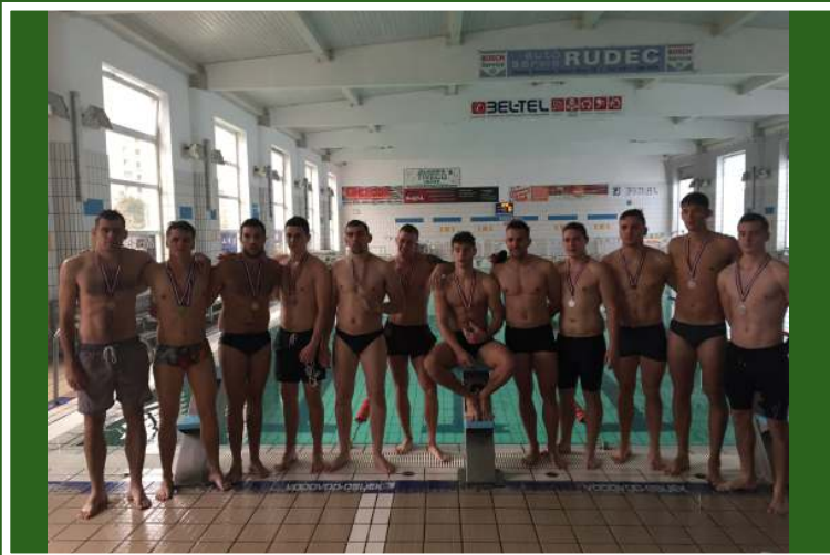
Studenti Sveučilišta s osvojenim medaljama na sveučilišnom natjecanju u plivanju, Osijek 2018.