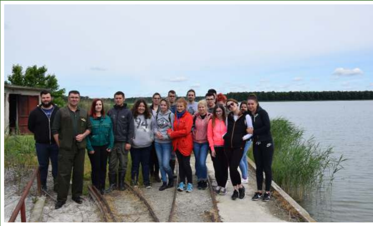
Terenska nastava studenata 3. godina smjera Zootehnika iz modula „Ribarstvo“ na ribnjačarstvu Grudnjak, PP Orahovica