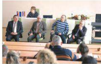
Okrugli stol i panel „Dobra poljoprivredna praksa“ u veljači 2018.