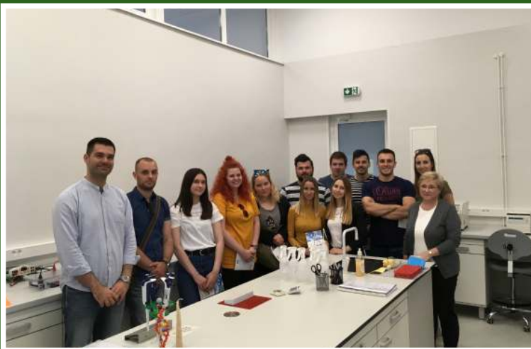
Terenske vježbe studenata diplomskog studija Zootehnika, smjera Specijalna zootehnika, iz modula Kvantitativna genetika i selekcija životinja u akademskoj godini 2018./2019. Obilazak Nacionalne banke gena i Središnjeg laboratorija za kontrolu kvalitete mlijeka.