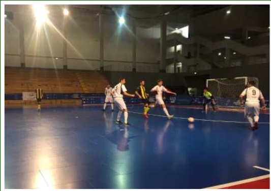
◀ Studenti Sveučilišta na europskom prvenstvu u futsalu, Braga Portugal 2019.