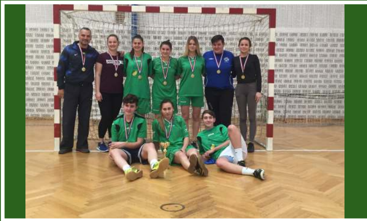
Studentice Fakulteta osvojile 1. mjesto na sveučilišnom prvenstvu u futsalu, Osijek 2019.