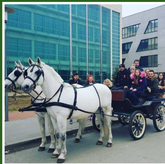
Studenti 1. godine diplomskog studija, smotra FAZOS-a, Osijek 2018.