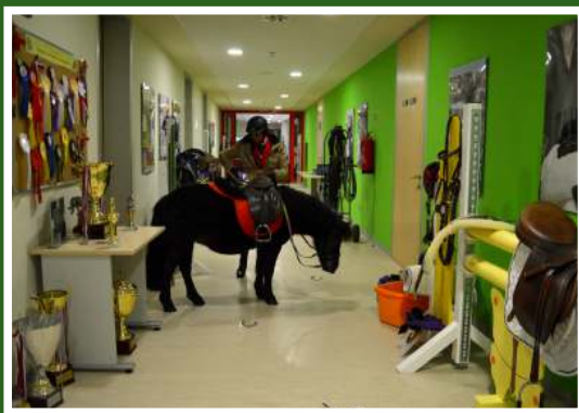
Aktivnost iz konjogojstva, Smotra FAZOSA, 2018.