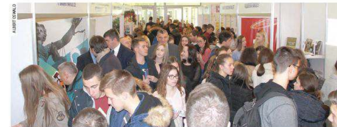
Prologodnja 21. Smotra Sveučilišta Josipa Jurja Strossmayera u Osijeku

disciplinarnoga područja znanosti i Akademije za umjetnost i kulturu u Osijeku. Nadalje, Senat je prihvatio izvješće o provedbi Internoga natječaja Sveučilišta Josipa Jurja Strossmayera u Osijeku za prijavu znanstvenoistraživačkih i umjetničkih projekata UNIOS - ZUP 2018. te donio Odluku o raspisivanju Natječaja za upis studenata (doktoranda) na poslijediplomski međusveučilišni interdisciplinarni studij Poduzetništvo i inovativnost koji se izvodi na Ekonomskom fakultetu u Osijeku. Na osnovi Izvješća Povjerenstva za programe cjeloživotnoga učenja članovi Senata izdali su suglasnost za utroj i izvedbu programa cjeloživotnoga učenja na Filozofskom fakultetu Osijek pod sljedećim nazivima: Program učenja njemačkoga jezika u svrhu visokookol- skih nastave; Hrvatski jezik, povijest i kultura sa strane te Pyton, računalno rasmisljanje i programiranje. Osim toga, prihvaćeno je izvješće o upisima studenata u prvu godinu na znanstveno/