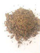
Suhi usitnjeni propolis

● S obzirom na postavljen cilj i interdisciplinarno obilježje projekta, suradnici na tom projektu znanstvenici (njih ukupno 11) su s triju sastavnica Sveučilišta Josipa Jurja Strossmayera u Osijeku – Fakulteta agrobiotehničkih znanosti Osijek, Prehrambeno-tehnološkoga fakulteta Osijek i Medicinskoga fakulteta Osijek – te s Veterinarskoga fakulteta Sveučilišta u Zagrebu.