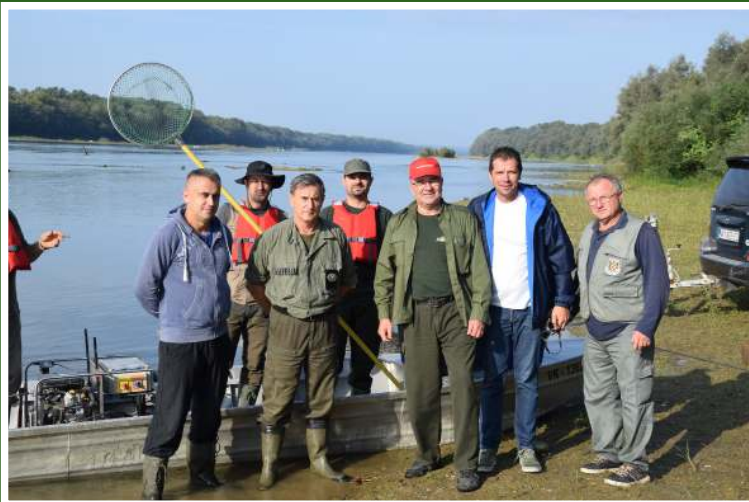
Terenska istraživanja na rijeci Savi u suradnji s Športsko ribolovnim savezom Brodsko-posavske županije i Elektroprojekt d.d.