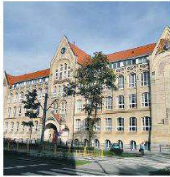
West Pomeranian University of Technology in Szczecin

▼ Ovo je Vaš treći posjet Osijeku, a planirate doći ponovno i četvrti put. Što Vas je privuklo u grad i što Vas drži i dalje ovdje?